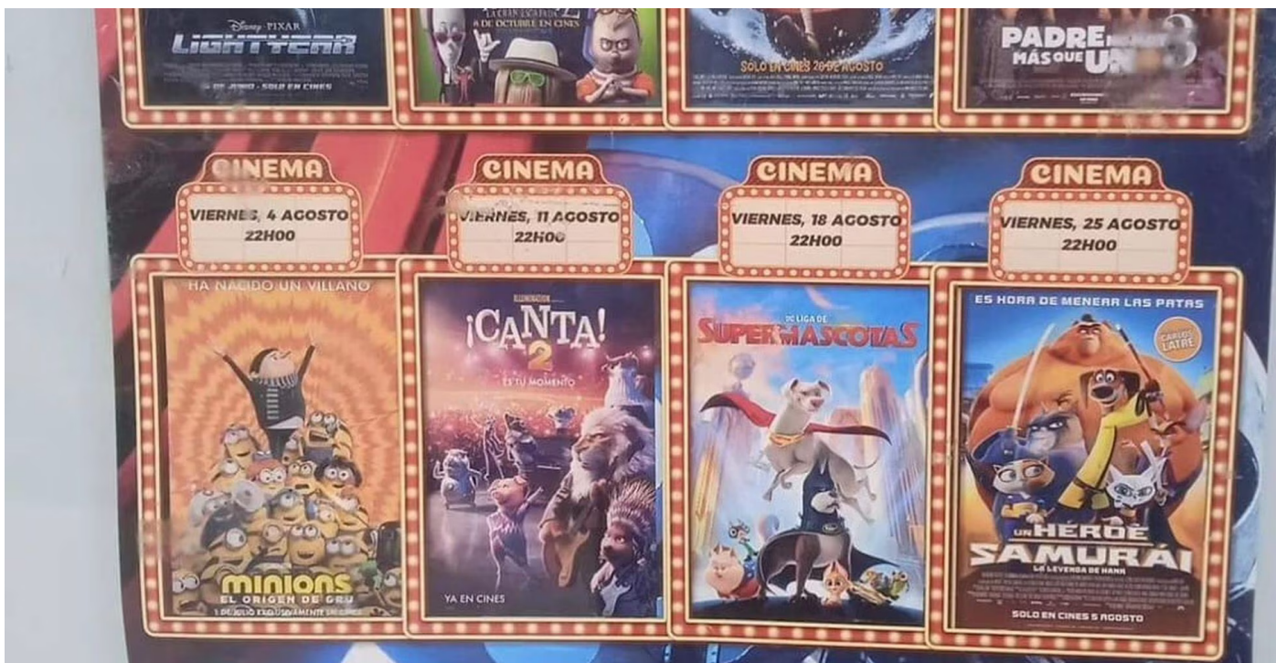
Cartel de la programación del cine de verano con la película 'Lightyear' (primera a la izquierda en la parte superior).