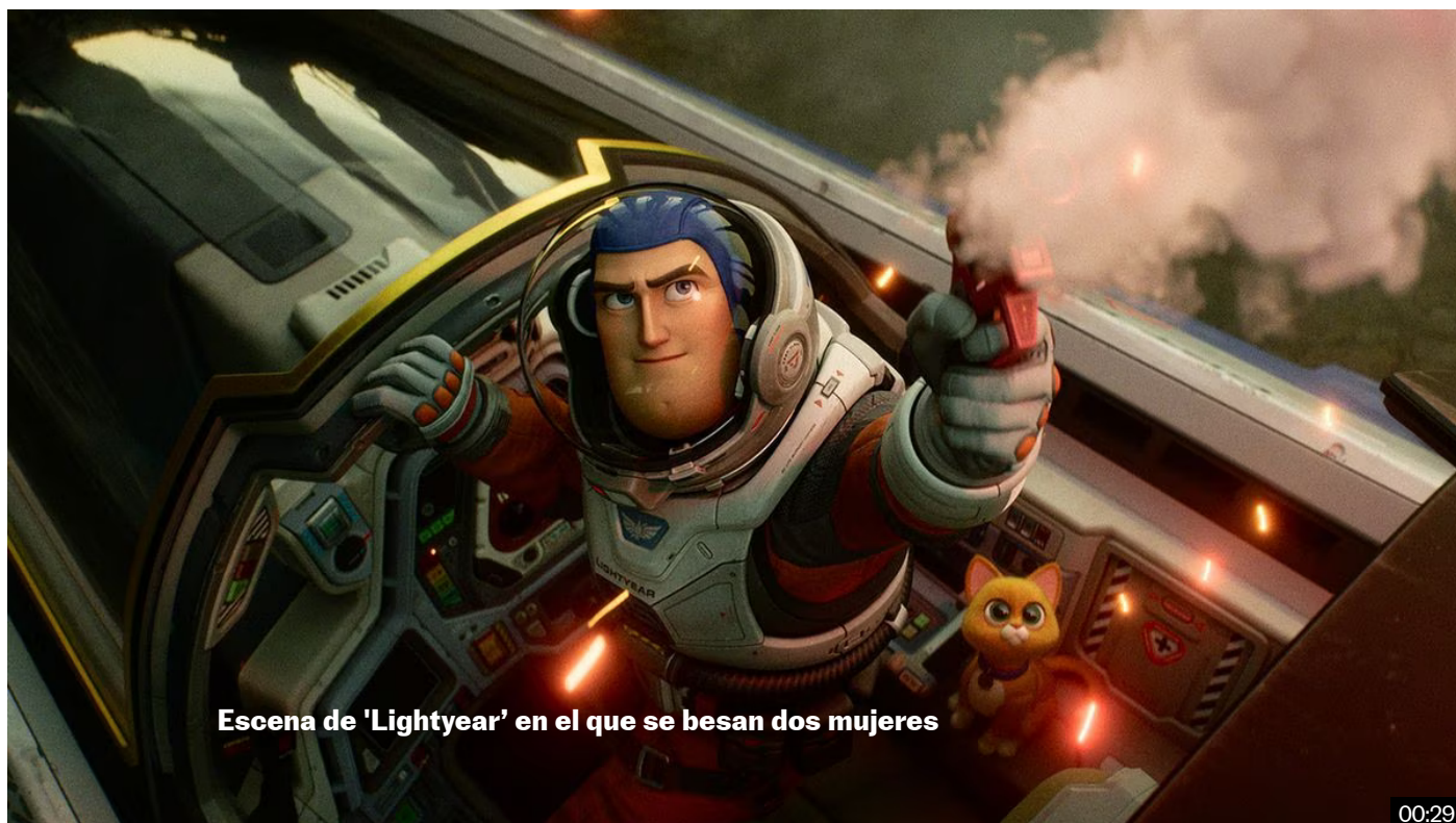
Escena de 'Lightyear' en el que se besan dos mujeres

El PSOE dejó programado un ciclo de cine del que ha desaparecido esta comedia de Pixar, vetada también en países de Oriente Próximo