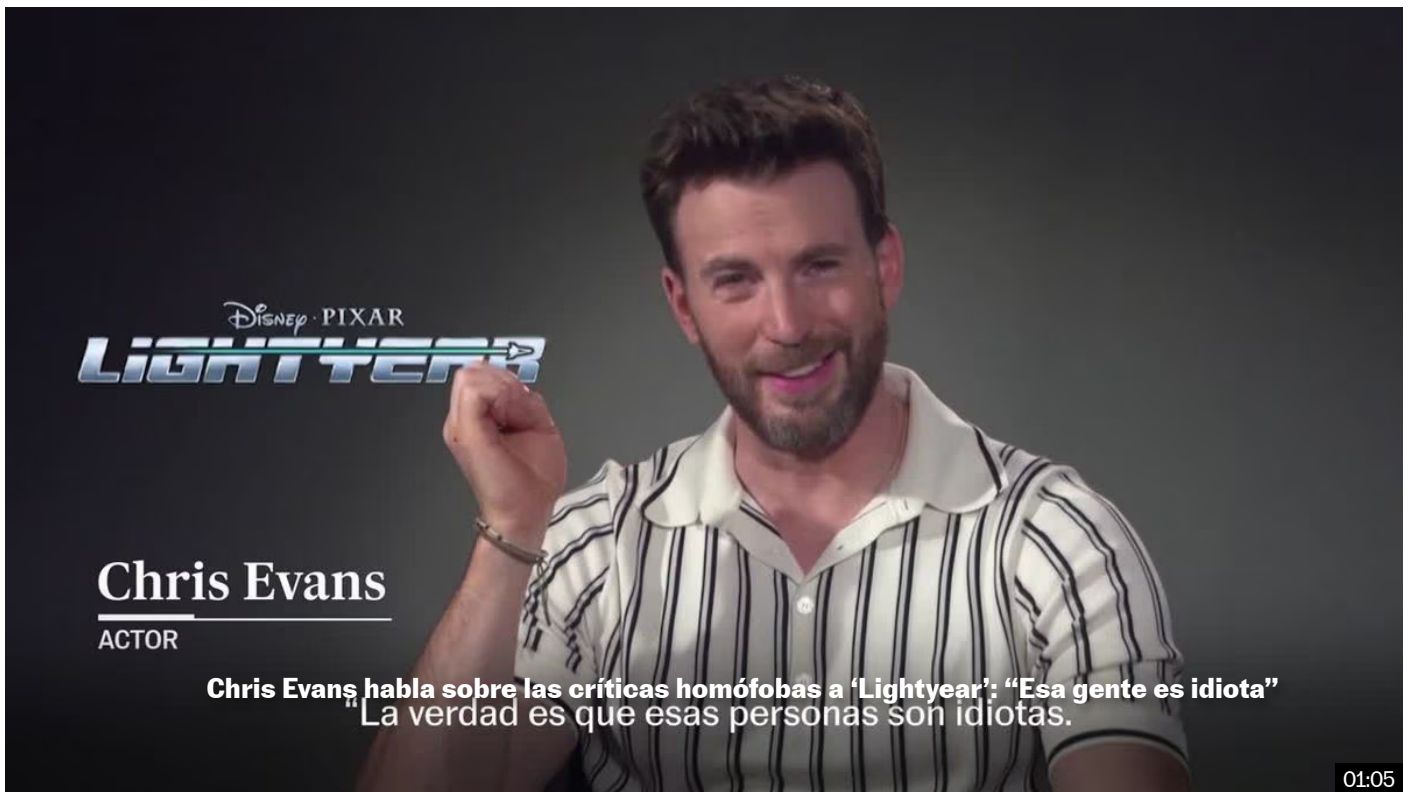
Chris Evans habla sobre las críticas homófobas a 'Lightyear': "Esa gente es idiota"