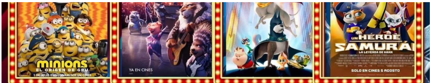
Cartel de la nueva programación de cine de verano de Santa Cruz de Bezana, sin 'Lightyear', sustituida por 'Los tipos malos'.

La llegada a los cines de esta película el pasado verano generó polémica por un momento de unos segundos en el que dos mujeres se dan un beso, lo cual escandalizó en países de Oriente Próximo y Asia aquel junio. La secuencia ya había provocado un terremoto previo en EE UU. Los ejecutivos de Disney, la empresa propietaria de Pixar desde 2006, pidieron cortar esa secuencia en un visionado previo al estreno. Esto provocó un estallido en marzo de 2022 de un escándalo dentro del gigante del entretenimiento. Cientos de empleados denunciaron la censura en una carta, como parte de una estrategia que pretendía que la cúpula de la compañía alzara la voz en contra de una ley discriminatoria en Florida, donde Disney posee seis parques temáticos (la medida prohíbe enseñar en las escuelas sobre cuestiones de género y homosexualidad a los estudiantes más jóvenes). Finalmente, Disney mantuvo el beso entre Hawthorne y su pareja, y además la compañía comenzó a realizar declaraciones públicas contra la ley de Florida.