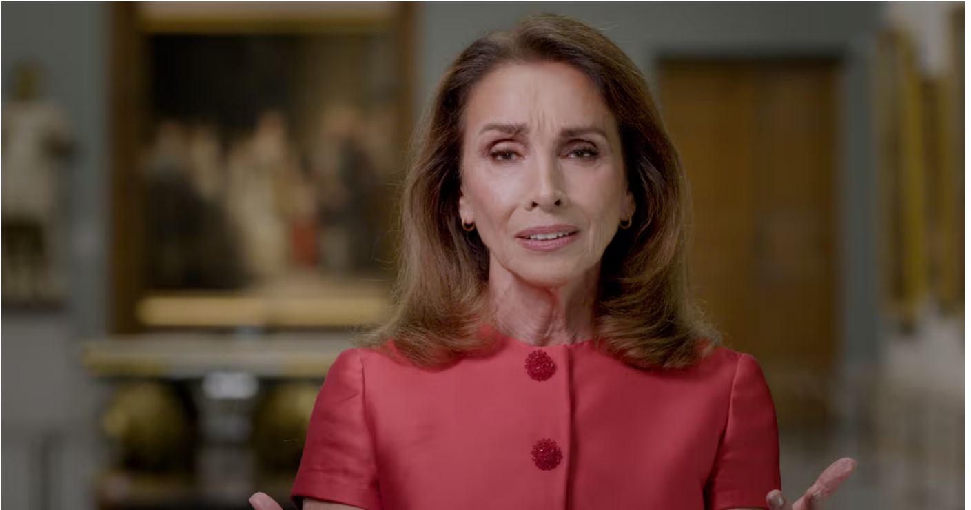
Ana Belén interpretando la canción 'España camisa blanca' en el vídeo producido por el Museo del Prado.

La artista interpreta la canción 'España camisa blanca', compuesta por Víctor Manuel, en un vídeo publicado por la institución en redes sociales